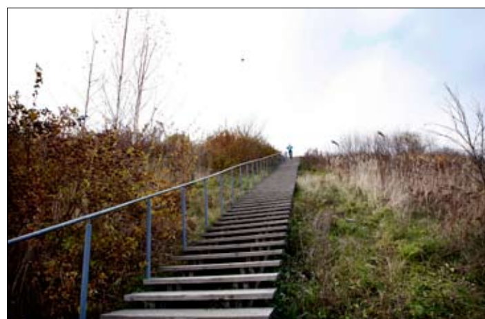
Vuorikiipeilijä treenaa jyrkähköissä portaissa ja rinnetiellä pari tuntia kerrallaan.